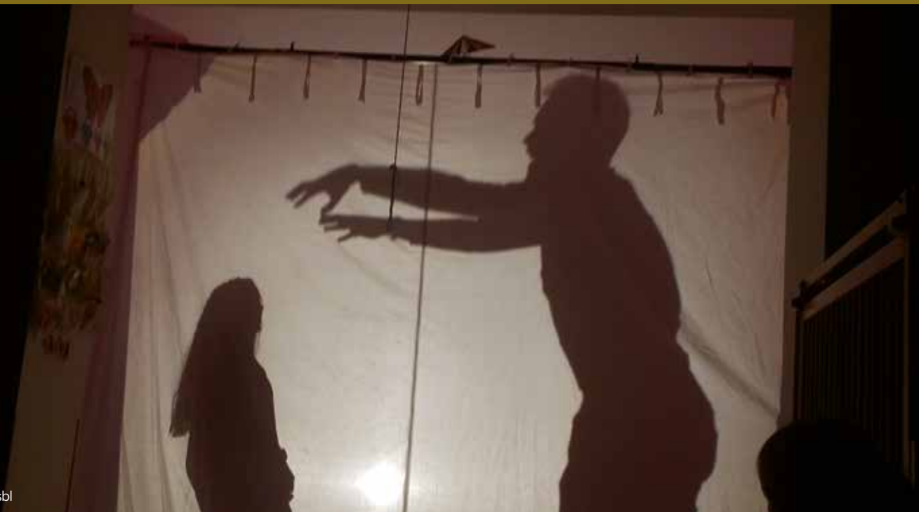
Théâtre d'ombres lors d'une journée pédagogique : une question de perspective.

religieuse et philosophique dans la fonction publique pour aboutir à la neutralité» 1 .