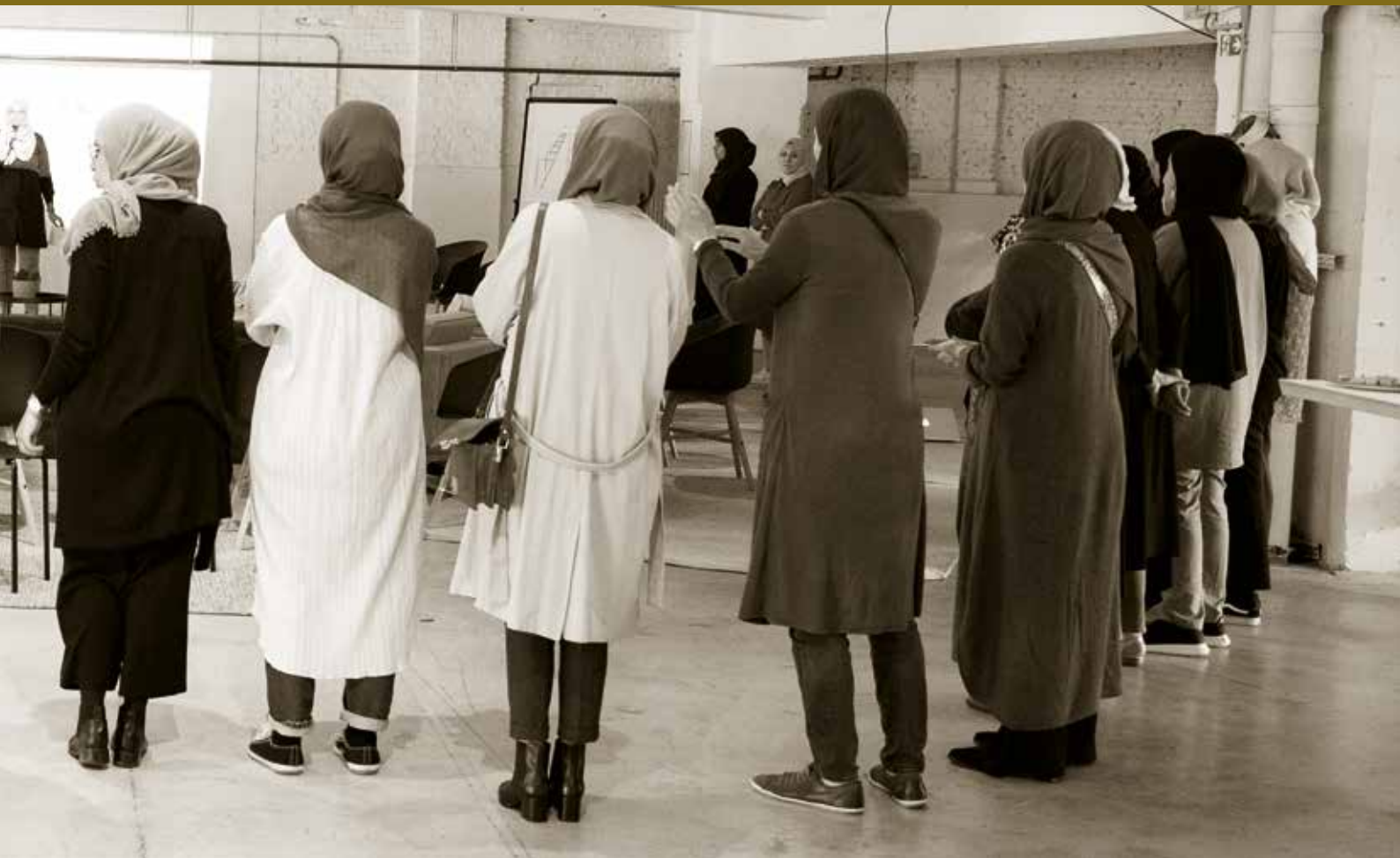
Une réunion du Collectif les 100 diplômées.