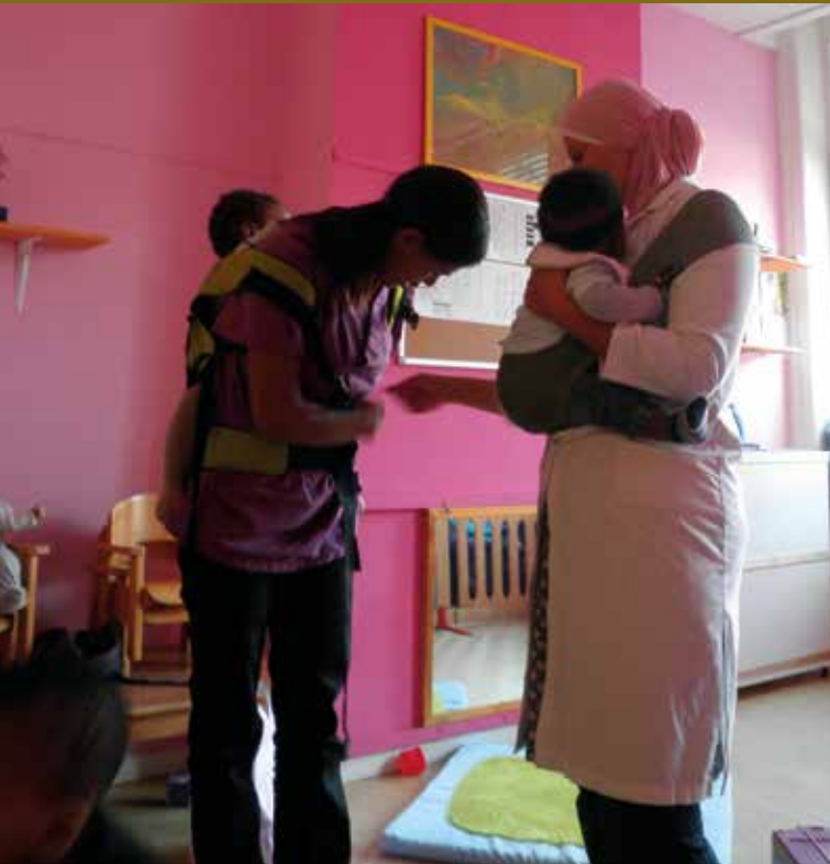
Formation de l'équipe des Amis d'Aladdin au portage en pagne.

ces enjeux que nous questionnons de façon permanente à travers notre pratique de la neutralité inclusive.